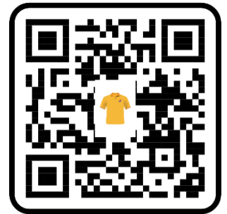
แบบเสื้อ 2024